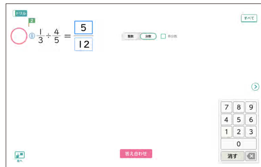
(例：6年 p.119 分数でわる計算)

正誤判定機能、解答表示機能がついたドリルコンテンツの追加を行いました。分数単元や巻末のプラス・ワンの問題にも対応しています。