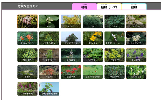
(3年 p.8、ツールバー>どうぐ>まなぶ)