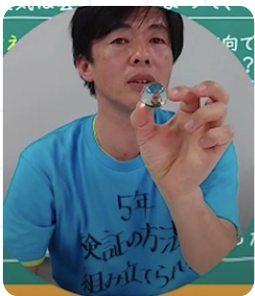
▲前回の講座のようす。